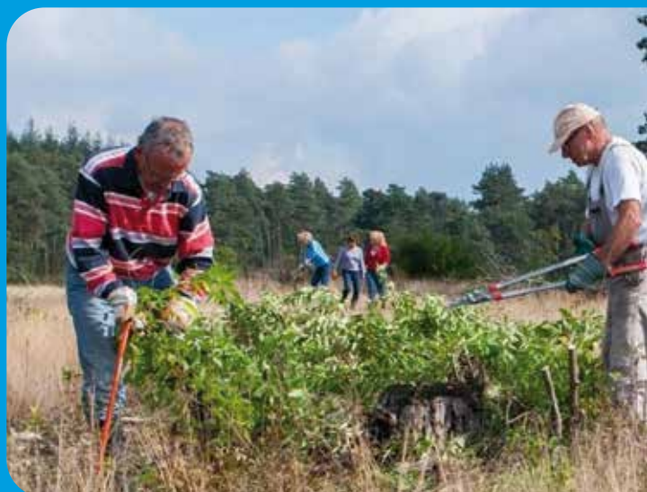
Vrijwilligers aan het werk