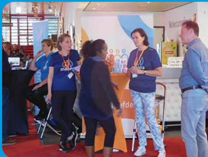
In gesprek tijdens de vrijwilligersmarkt